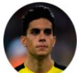
Marc Bartra Borussia Dortmund