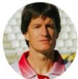
"Motoret" Sala Albacete Balompié