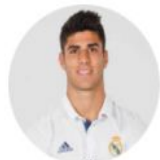
Marco Asensio Real Madrid CF