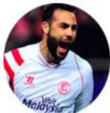
Iborra Sevilla CF