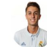
Gori Real Madrid CF