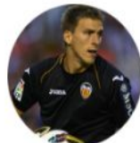
Guaita Valencia CF