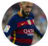
Aleix Vidal FC Barcelona