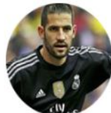
Kiko Casilla Real Madrid CF