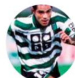
Toñito Sporting CP