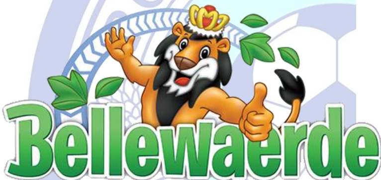
Parc d'attractions Bellewaerde (Ypres) et Walibi (Wavre) à 88 km