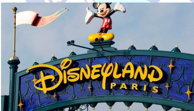
Parc d'attraction Disneyland Paris à 290 km