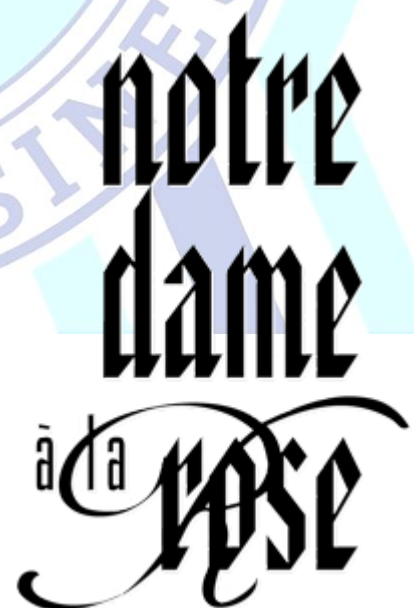
Notre Dame à la Rose à 5 km